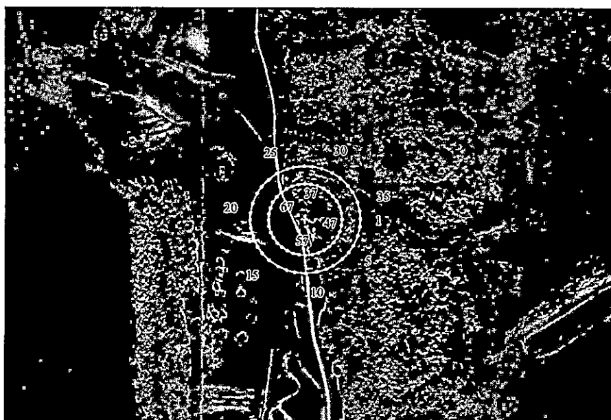
Карта-схема охранной зоны