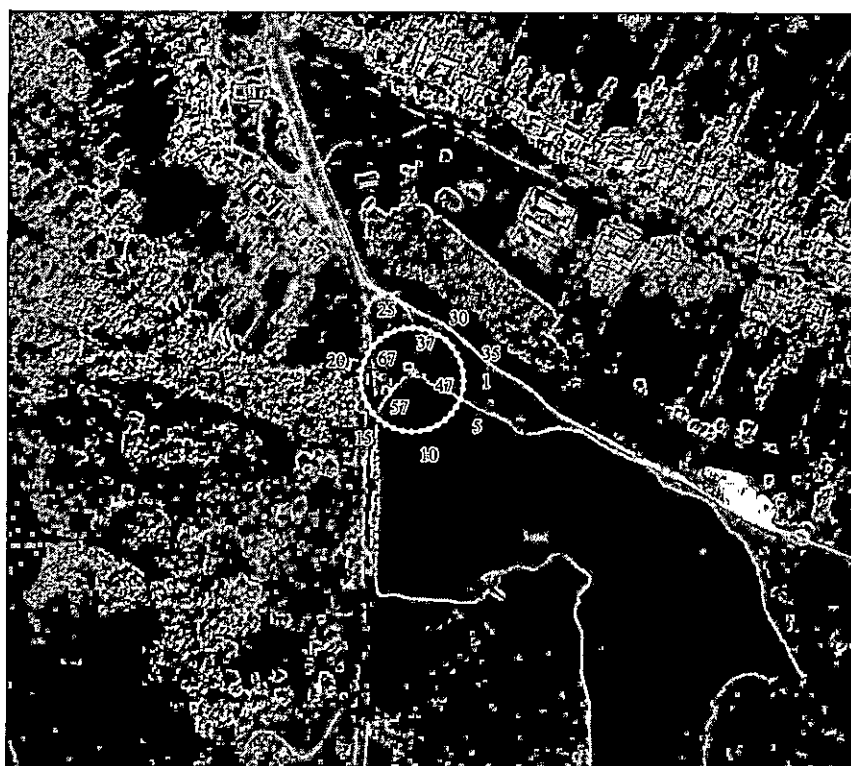
Карта-схема охранной зоны