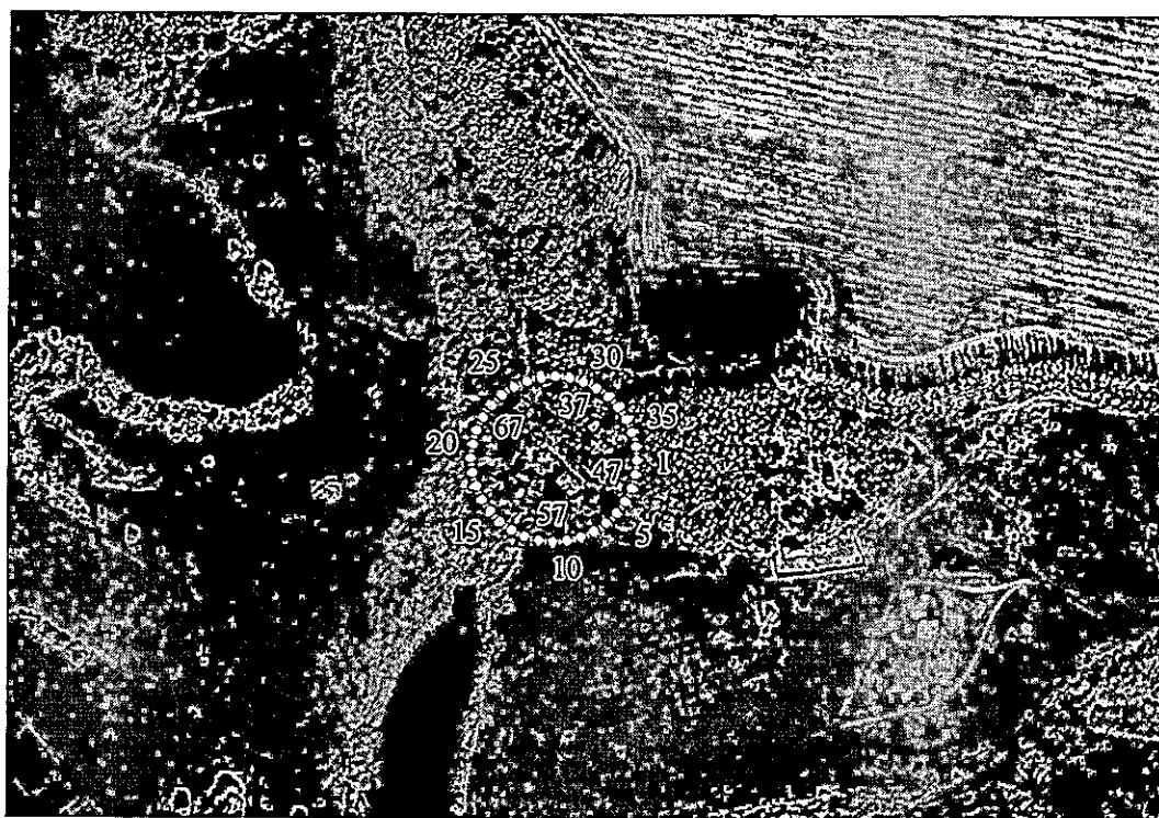
Карта-схема охранной зоны