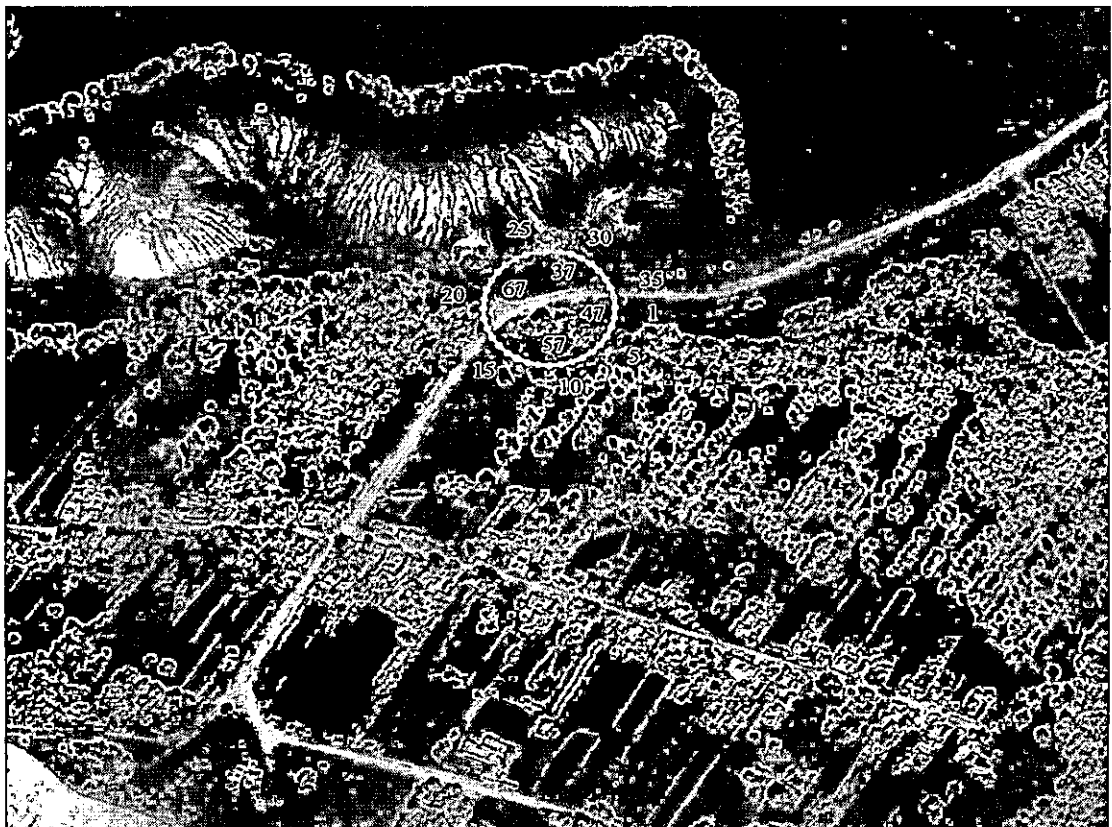
Карта-схема охранной зоны