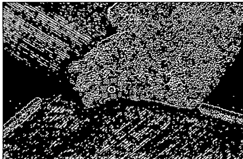
Карта-схема охранной зоны